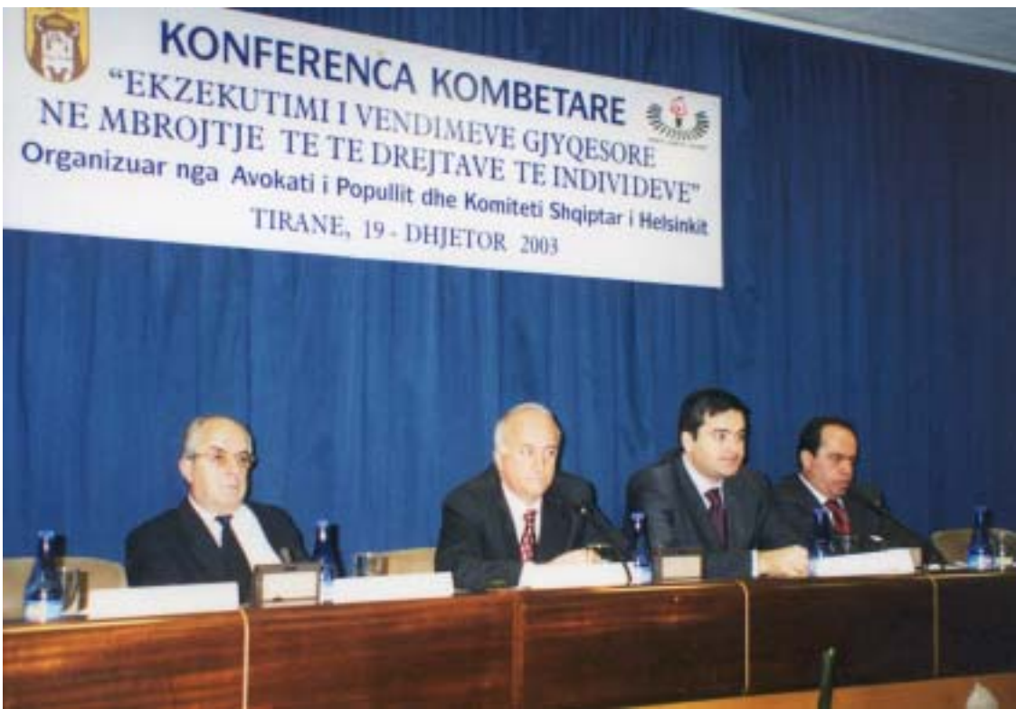
Në fotot: Nga Zhvillimet e punimeve të Konferencës Kombëtare

“EKZEKUTIMI I VENDIMEVE GJYQESORE TE FORMES SE PRERE NE MBROJTJE TE TE DREJTAVE TE INDIVIDEVE”.